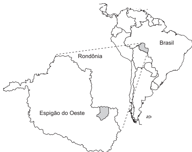
Figura 1. Mapa da América do Sul com a localização de Espigão do Oeste (RO) - Brasil.

O estudo foi realizado entre fevereiro de 2001 e março de 2002, na Fazenda Jaburi (11° 35' - 11° 38' S e 60° 41' - 60° 45' W), Município de Espigão do Oeste (RO) (Figura 1). A região encontra-se no